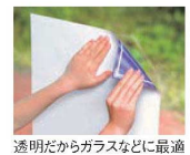
透明だからガラスなどに最適

●接着力の強い両面テープです。 ●はかり紙をはがしてすぐ使えます。 【用途】ブックや掲示物の取り付け、家具や置物の固定、DIYなど