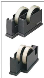
刃の位置は2通りできます。