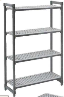
固定式シェルフキット