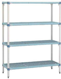
シェルフメトロマックスQ ライトグレイ/棚マットライトブルー