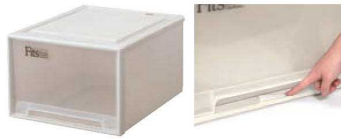
クローゼット(ワイド) M-53、L-53のみ引出しの飛び出しを妨ぐ引出しロック機構付きです。

81 棚・作業台 74 卓上鍋・焼物用品 75 料理演出用品 76 卓上小物 77 卓上サイン 78 福祉・養育用品 79 店舗備品 80 店舗備品