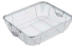
②ビクトリー 18-8 クリーンバスケット A型 浅型