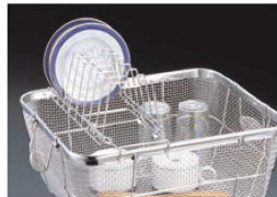
⑤ビクトリー 18-8 クリーンバスケット用 皿立てスタンド