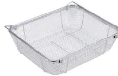
④ビクトリー 18-8 クリーンバスケット B型 浅型