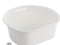
⑫ラウンド H&H ウォッシュタブ ホワイト