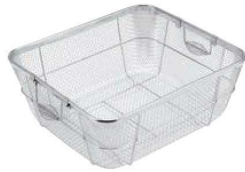
①ビクトリー 18-8 クリーンバスケット A型 深型