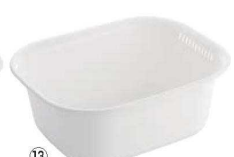
⑭D型 クッキングパル 洗い桶