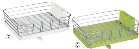
Nボゼ 縦横兼用 クリアコート水切り

材質:本体/スチール(ユニクロメッキ+粉体塗装) キャップ/シリコン ●シンクのスペースを有効活用でき、調理スペースが広く使え、台所仕事がより快適になります。 ●キャップとワイヤーが取り外せるので水道蛇口を避けて設置することもできます。 ●使わない時はクルッと巻いて収納できます。