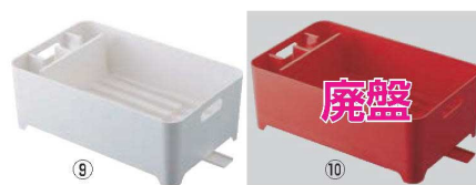
水切りバスケット アクア

●脚/塩化ビニル樹脂 ●排水・止水が切り替えできるシリコン栓付 ●自在に動く可動式排水口