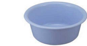
⑪アシスト 洗桶 ブルー