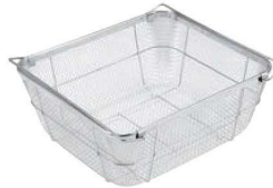
③ビクトリー 18-8 クリーンバスケット B型 深型