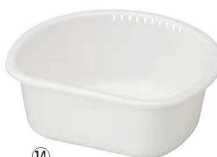
⑭D型 クッキングバル 洗い桶