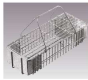
①EBM 18-8 寸胴型 箸消毒カゴ