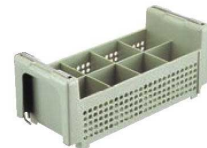
⑭ヴォラース シルバーバスケット 52841 (ライトグリーン)