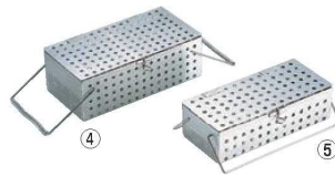
④UK 18-8 パンチング スプーン 消毒カゴ