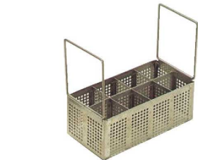
⑫レーバン シルバーコンパートメント バスケット SWB-4SS