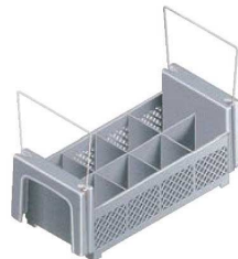
⑬キャンプロ フラットウェアバスケット カムラック 8コンパートメント