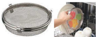
⑦18-8 食洗機用小物カゴ LS1533