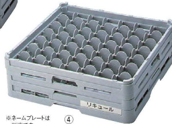
※ネームプレートは別売です。