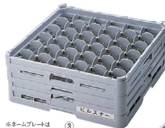
※ネームプレートは別売です。