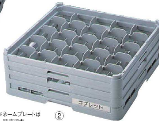
※ネームプレートは別売です。