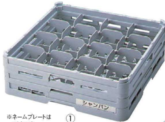
※ネームプレートは別売です。