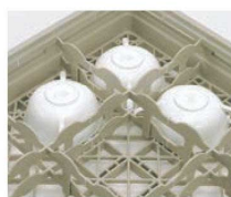
④カップラック フルサイズ デミタス・ピヨン用