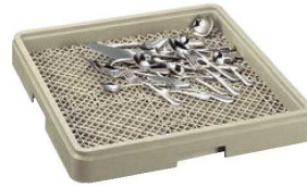
②シルバーラック フルサイズ