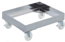
①EBM 18-8 角型キャリア