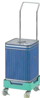
⑥缶きちキャリア ステンレスハンドル付