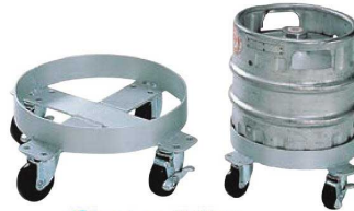
③アルミ 生樽用 台車