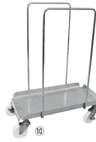
オールステンレス袋キャリア