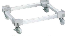
②ビールコンテナ用 台車 AP-No20