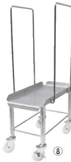
HACCP300オールステンレス袋キャリア