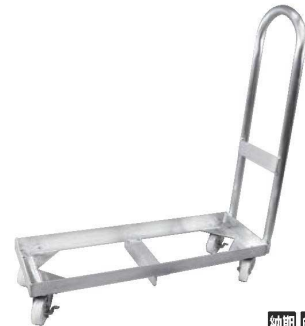
⑦アルミ製 一斗缶台車 H型 3缶用