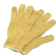
⑥ スーパーアラミド手袋 No.810