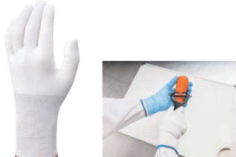
⑦ ショーフ 耐切創手袋 テュラコイル 546X