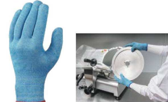
⑨ ショーフ ケミスターワイヤーフィットプラス 521 Plus