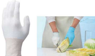
② ショーフ手袋 ケミスター フィット No.520