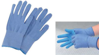
⑤ エスター 耐切創インナータイプ手袋 No.800 ブルー