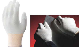
③ 耐切創手袋 ケミスターパーム No.540