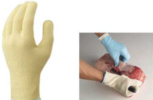
⑧ ショーフ 耐切創手袋 ケミスター ワイヤーフット No.521