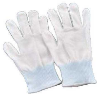
① カットレジストインナー手袋 No.145