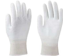
④ カットレジスト No.170