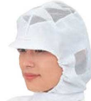
⑰フードキャップ E型 SK 7503