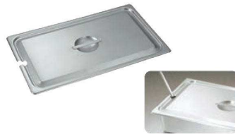
③ 18-8 ホテルパン蓋NC型 (レール用切込穴付)