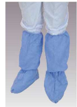
④ブーツカバー 66160 フリーサイズ (50枚入) ㊦