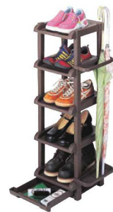
⑮シューズラック ブラウン 5段 ㊦