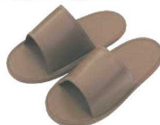
⑧シューズオンスリッパ No.1158 ㊦

靴を履いたまま使用するスリッパです。工場などの油やその他の汚れを事務所などに持ち込まないための製品です。また、ワンタッチで脱ぎ履きでき、手も汚さず便利です。