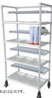
⑬イクター 抗菌シューズラック 2段タイプ ㊦