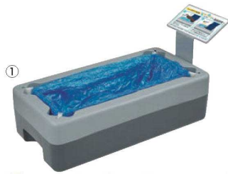
①シューズカバー取付器 シューボン ㊦