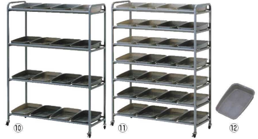
⑩シューズラック 長靴用 トレー付 1X561Y ZD77 ㊦