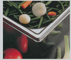
④コーナーのプレス加工で一段と強度がアップしました。