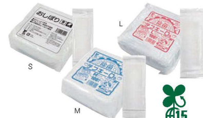
⑨平型おしぼり デフキオーズリー