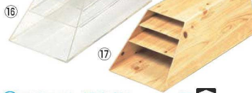
⑯アクリル 経木差し