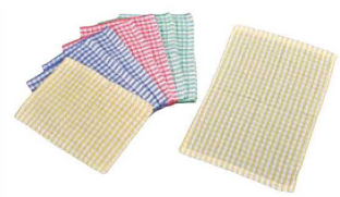
⑥テーブルクロス兼用オシボリ チェック柄 (4色×2)