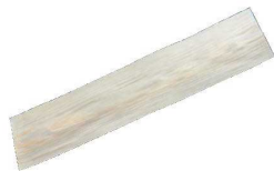
⑮経木うす板 (1束=100枚入)