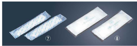
⑦紙おしぼり エレガンス ロールタイプ (1,000本入)