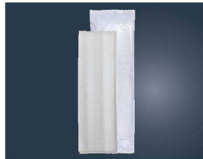
⑫パール不織布おしぼり 平型 超大判 (70本入×10袋) 300×265

材質:シルブ不織布 ●両手を覆う超大判で贅沢な使い心地 ●温めても冷やしても使えます。