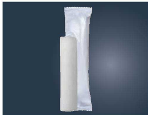
⑪パール不織布おしぼり 丸型 超大判 (50本入×12袋) 350×295