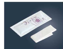
⑭ミニおてふき C型 (400枚入)

200×200 1ケース:100本×20袋 原反:スパンレース(レーヨン)60g素材