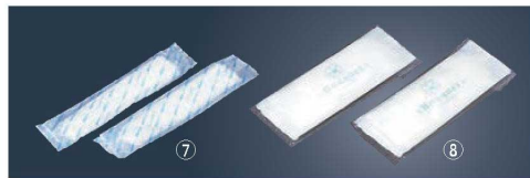
⑦紙おしぼり エレガンス ロールタイプ (1,000本入)