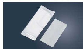
⑬パールフィルム おしぼり (2,000本入)