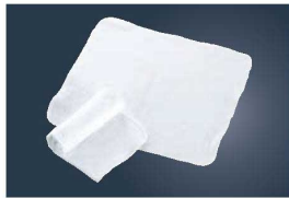
①EBM 高級タオルおしぼり No.170 (12枚入) ホワイト