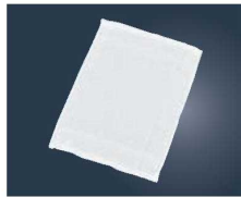
②EBM タオルおしぼり No.80 (12枚入り) ホワイト

340×340 材質:綿100% ●シャワーリング加工で手ざわりが良く高級感があり、吸水性にも優れています。 ●オーバーロック巻