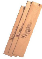
⑩ 紙製 フランスパン袋 (100枚入) ㊦