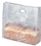
⑤ フランス文字柄 パン袋 (100枚入) ㊦