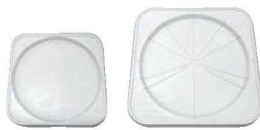
⑪ ケーキトレイ (50枚入)