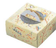
⑫ ハンドボックス 6号 (100枚入) 02865 メルヘンパート I