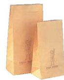
⑦ 紙製 パン袋 (500枚入) ㊦