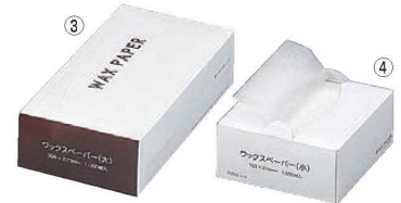
ワックスペーパー (1,000枚入)