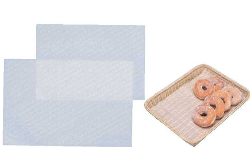
① グラシン紙 柄入 E-50 (100枚入) ㊦