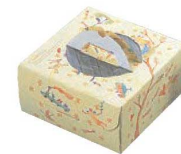
⑫ ハンドボックス 6号 (100枚入) 02865 メルヘンパート I