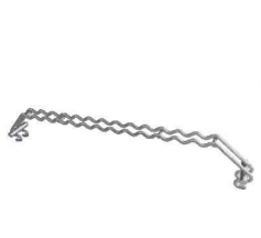
⑧18-8 バーベキューブリッジ 93