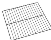
⑦EBM 18-8 グリッド網 フッ素樹脂Wコート