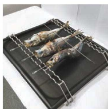
⑨EBM 18-8 G/Nパンカバー & マナ板スタンド