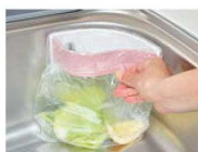
⑯水切り水きれくん (15枚入) 三角コーナー用