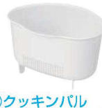
⑫クッキングパル 深型 三角コーナー L K-1344WH