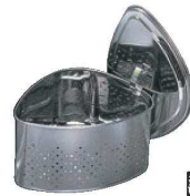
⑧抗菌ステンレス 蓋付 三角コーナー CK-114