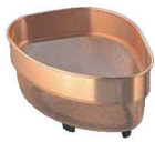
①ピュリティー 純銅メッシュ 三角コーナー