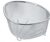
③18-8 三角コーナー 水きれ〜