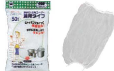
⑱水切りゴミ袋 ごみシャット 排水口・三角コーナー兼用 (50枚入) M-296