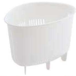
⑪H&H コーナーポケット ホワイト