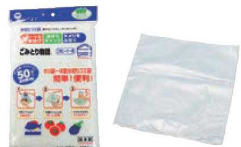
⑰水切りゴミ袋 ごみとり物語 BGW-250 三角コーナー用 (50枚入)