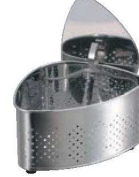
⑨抗菌ステンレス 圧縮蓋付 三角コーナー CK-115