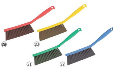
HPMベーカー磁性ブラシ