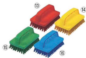
HPMハンド磁性ブラシ 角型