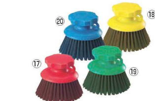
HPMハンド磁性ブラシ 丸型