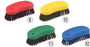
HPMハンド磁性ブラシ S