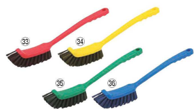
HPMロングハンドル磁性ブラシ

サイズ:350×35×H110 毛の長さ:50 ●テーブルやカウンター表面の持ち取りブラシで、粉末や細かいゴミの掃除に最適です。