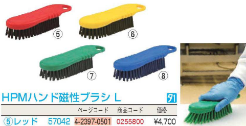
HPMハンド磁性ブラシ L