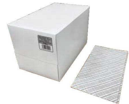
⑦グルメクロス (70枚入) グレー

シートサイズ:300×600 材質:レーヨン100% ●抗菌仕様のため、菌の増殖による嫌な臭いを抑えます。