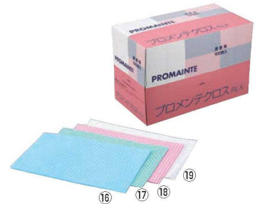
プロメンテクロス 厚手小判RLX (100枚入)

シートサイズ:500×600 材質:レーヨン+ポリエステル ●スーパーのバックヤード・食品加工工場などに最適 ●テーブル拭き・食器拭き・レンジまわり・その他オール、ふきんとして様々な用途にご利用いただけます。