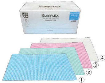
クラフレックス カウンタークロス (60枚入)