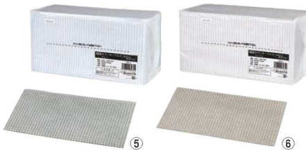
カウンタークロス (100枚入)

シートサイズ:350×610 材質:レーヨン100% ●汚れが落ちやすく、乾燥が速いので、細菌付着数が少なく衛生的です。 ●すぐれた吸水性です。 ●洗濯・漂白・殺菌が可能です。