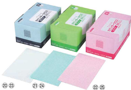
クレシア 抗菌カウンタークロス 厚手 (60枚入)

シートサイズ:300×600 材質:レーヨン+ポリエステル ●ファミリースタイル・ホテル・お持ち帰り用お弁当・惣菜・寿司店などに最適