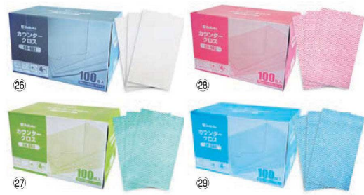
DK カウンタークロス (100枚入)