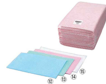
プロメンテクロス 厚手大判WJX (40枚入)

シートサイズ:300×600 材質:天然バリエル+不織布 ●天然の木材バリエルと不織布の構造が、水分や油分汚れを内部にしっかりと吸い込み逃がしません。優れた乾きの早さで衛生的です。