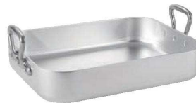
⑤ムヴィエール アルミ ロティール 1113