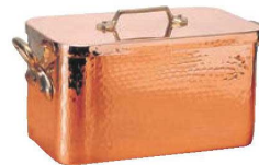
⑧ムヴィエール 銅 プレザール 2153