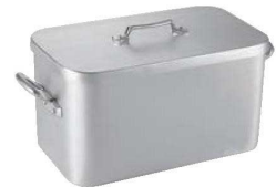
⑥ムヴィエール アルミ プレザール 1111