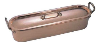
⑨ムヴィエール 銅 ポワンニエ 2160