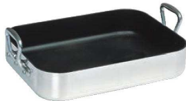
④ムヴィエール シルバーストーン ロティール 9850