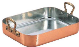
⑦ムヴィエール 銅 ロティール 2155