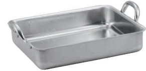
③マトファー/ブウジャ 18-10 手付 ローストパン7135