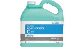
⑪シーバイエス セーフフラッチ ハンドソープ プラスC 5ℓ ㊦

ページコード 商品コード 価格 4-2437-1101 8392920 ¥9,000