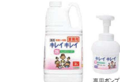
⑩ライオン キレイキレイ 薬用泡ハンドソープ 2ℓ ㊦

ページコード 商品コード 価格 専用ポンプ付 4-2437-1001 1065610 ¥2,700