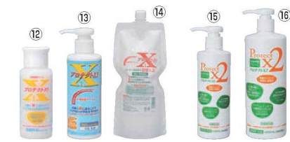
皮膚保護クリーム プロテクト ㊦