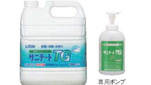
⑧ライオン 手洗い用液体石鹸 サニテイトTG 4ℓ 専用ポンプ付 ㊦

ページコード 商品コード 価格 4-2437-0801 0109210 ¥5,200