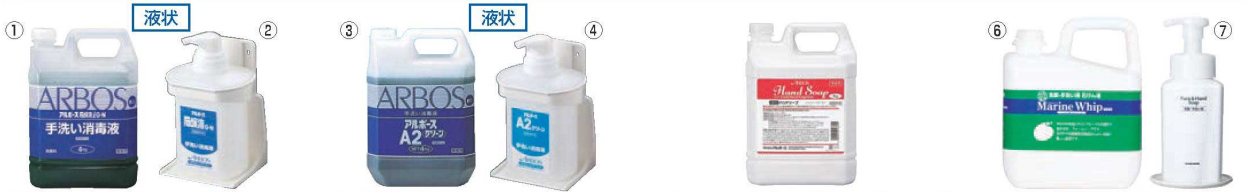
①アルボース 石鹸液 iG-N 4kg ㊦

ページコード 商品コード 価格 4-2437-0101 4622010 ¥6,600