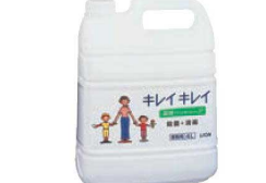
⑨ライオン キレイキレイ 薬用ハンドソープ 4ℓ ㊦

ページコード 商品コード 価格 4-2437-0901 0119200 ¥4,900