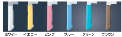
ホワイト イエロー ピンク ブルー グリーン ブラウン