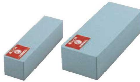
⑥赤エビ 荒砥石 (#220)