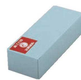
⑦赤エビ印 金剛砥石 No.400