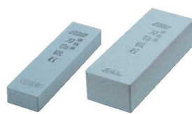
⑤EBM 荒砥石 (#220)