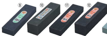
金剛C No.100 荒砥石