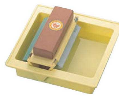
⑧ 砥石台 プロシャープ