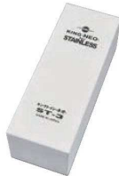
⑦ キングトイシ・ネオ 中仕上 (#800)