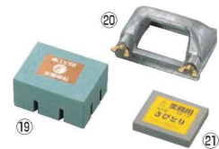
⑲ 砥石 レンジストーン(#220)