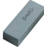
③ 人造 青砥石 中仕上