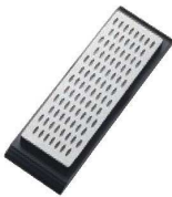
⑥ ダイヤモンド 台付 シャープナー #800