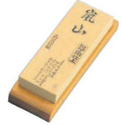
⑤ 人造嵐山 仕上台付砥石