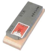
② 大平砥山 超仕上 天然砥石 40型(台付)