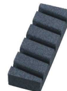
⑨溝入り面直し砥石