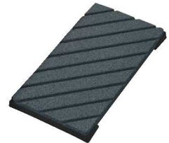
⑤溝入り面直し砥石 簡易ゴム台付

別売で 細目パウダー 4-0316-0404 6661600 ¥3,600もご用意。