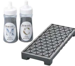
④セラミック 砥石修正器「なおる」研

●砥石の研磨面を目詰まり取り・研く前の砥泥出し・砥石の平滑性向上・砥石エッジ部の面取り・など、砥石本来の持ち味や研ぎ味を十分に發揮させます。 ※名倉砥石に水を含ませ砥石表面も濡らした状態でご使用ください。