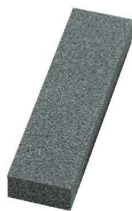
⑥修正砥石 ダイヤブリック #36