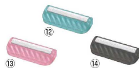
庖丁研ぎホルダー TOGRIP