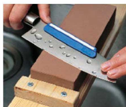
⑪庖丁研ぎホルダー スーパートゲール