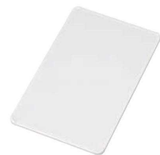
⑦ トンボ 超軽いまな板