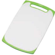
① トンボ ラバー付 耐熱抗菌まな板