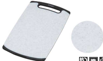
② トンボ おこししやすいラバー付 耐熱抗菌まな板 石目調

材質:ポリプロピレン、熱可塑性エラストマー ●ラバーの滑り止め付きです。 ●両面使用可能です。