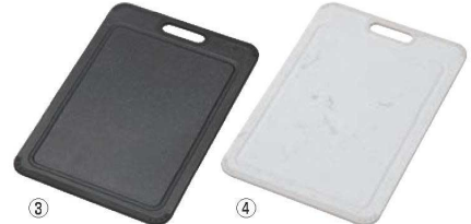
③ トンボ NEWラバー付ワイドまな板

材質:本体/ポリプロピレン、ラバー部/熱可塑性エラストマー ●両面ミソ付きでおこしやすいです。 ●ラバー付きで滑りにくいです。