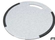
⑪ トンボ おこししやすいラバー付 耐熱抗菌まな板 石目調