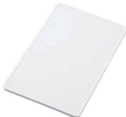
⑤ トンボ 軽いまな板 シンク