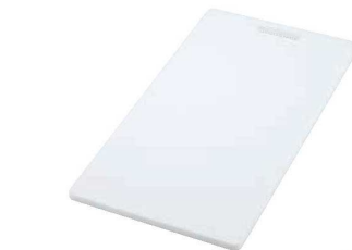
⑥ 耐熱抗菌 シンクまな板

材質:外側/ポリプロピレン、芯材/リサイクルペーパー、フチ部/熱可塑性エラストマー ●軽くて扱いやすい ●すべりにくいノンスリップ加工 ●抗菌加工(SIAA抗菌適合) ●シンクに深さを48.5cm