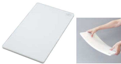
⑩ エラストマー やわらか抗菌まな板

材質:ポリエチレン、オレフィン系エラストマー ●シンク付 ●表面がやわらかく心地よい刃当たり、セラミック庖丁にも最適です。 ●食器洗い乾燥機もOKな三層構造まな板です。 ●安心・安全無機系抗菌剤使用。[SIAA] ●表面の弾力性で食材もまな板もすべりにくいです。