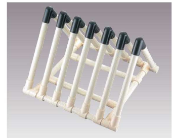
⑧EBM イレクター まな板スタンド

ページコード 商品コード 価格 4-0357-0701 6056500 ¥40,000 外寸:390×250×H430 ●厚さ45mmまでのまな板が3枚立てられます。