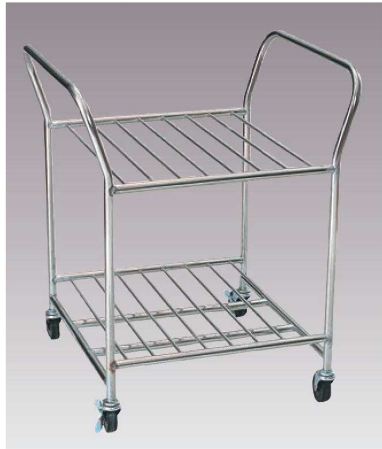
①EBM 18-8 まな板立 ドローリー

ページコード 商品コード 価格 4-0357-0101 6056610 ¥68,000 外寸:575×515×H700 キャスター:φ65×4(自在ストッパー2ヶ付) 材質:18-8ステンレス 有効内寸:400 ●厚さ40mmまでのまな板が7枚立てられます。