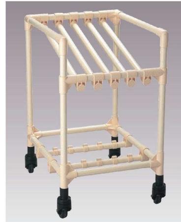
②EBM イレクター まな板ドローリー

ページコード 商品コード 価格 4-0357-0101 6056610 ¥68,000 外寸:575×515×H700 キャスター:φ65×4(自在ストッパー2ヶ付) 材質:18-8ステンレス 有効内寸:400 ●厚さ40mmまでのまな板が7枚立てられます。