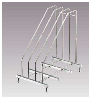
⑦EBM 18-8 まな板立 (タテ型)

ページコード 商品コード 価格 ⑤トレー付 4-0357-0501 8116000 ¥17,500 ⑥トレー無 4-0357-0601 8116010 ¥15,500 外寸:290×280×H328 ●厚さ30mmまでのまな板が5枚立てられます。