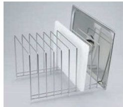
③EBM 18-8 G/Nパンカバー& まな板スタンド

ページコード 商品コード 価格 4-0357-0301 3603500 ¥13,400 外寸:420×270×H270 ●まな板、500×270×厚さ30mmまでのものが10枚まで収納できます。