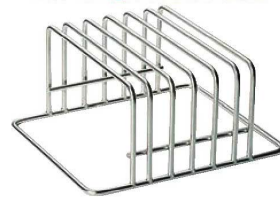
④EBM 18-8 まな板立 (極太φ10mm)

ページコード 商品コード 価格 4-0357-0401 3556500 ¥23,600 外寸:400×340×H195 20mm…2枚 30mm…4枚 計6枚