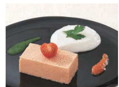
食材を個々に処理した後