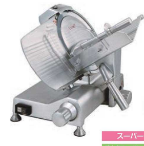
スーパー 焼肉店、しゃぶしゃぶ店

⑤プロシェフ ミートスライサー ページコード 商品コード 価格 MS25HA 4-0390-0501 6410410 ¥163,000 外寸:479×400×H358(最高455) 電源:単相100V (50/60Hz) 92/106W 定格時間:15分 厚さ調整:1~12mm 重量:16.4kg 切断有効寸法:①130 ②170 ③230 作動方式:手動式 用途:ハム、ソーセージ、しゃぶしゃぶ(半冷凍)、野菜 ●半解凍の肉のスライスに最適