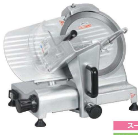
スーパー 焼肉店、しゃぶしゃぶ店

④プロシェフ ミートスライサー ページコード 商品コード 価格 MS30HA 4-0390-0401 6936310 ¥248,000 外寸:577×495×H444(最高530) 電源:単相100V (50/60Hz) 116/112W 定格時間:15分 厚さ調整:1~14mm 重量:23kg 切断有効寸法:①180 ②190 ③275 作動方式:手動式 用途:ハム、ソーセージ、しゃぶしゃぶ(半冷凍)、野菜 ●半解凍の肉のスライスに最適