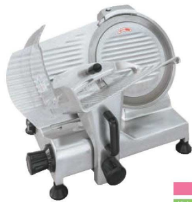
スーパー 焼肉店、しゃぶしゃぶ店

③フードスライサー ページコード 商品コード 価格 D-25PRO 4-0390-0301 5557220 ¥197,000 外寸:510×380×H400 電源:単相100V (50/60Hz) 150W 定格時間:30分 厚さ調整:0.5~15mm 重量:13kg 切断有効寸法:①170 ②210 作動方式:手動式 用途:しゃぶしゃぶ肉(半冷凍)、チャーシュー、キャベツ 付属品:シャープナー