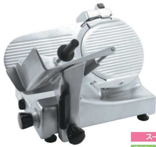
スーパー 焼肉店、しゃぶしゃぶ店

①ハムスライサー ページコード 商品コード 価格 AGS-300S 4-0390-0101 6410500 ¥440,000 外寸:625×520×H418 電源:単相100V (50/60Hz) 248W 定格時間:40分 厚さ調整:1~13mm 重量:29kg 切断有効寸法:①160 ②230 ③280 作動方式:手動式 能力:1,000~1,500枚/h 用途:ハム、ベーコン、すき焼き、しゃぶしゃぶ(半冷凍)、野菜、タン