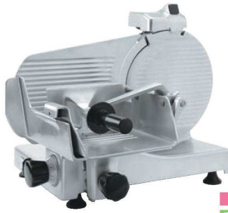
スーパー 焼肉店、しゃぶしゃぶ店

①ハムスライサー ページコード 商品コード 価格 AGS-300S 4-0390-0101 6410500 ¥440,000 外寸:625×520×H418 電源:単相100V (50/60Hz) 248W 定格時間:40分 厚さ調整:1~13mm 重量:29kg 切断有効寸法:①160 ②230 ③280 作動方式:手動式 能力:1,000~1,500枚/h 用途:ハム、ベーコン、すき焼き、しゃぶしゃぶ(半冷凍)、野菜、タン