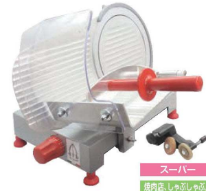
スーパー 焼肉店、しゃぶしゃぶ店

②ハムスライサー ページコード 商品コード 価格 AC-300S 4-0390-0201 6410600 ¥445,000 外寸:655×620×H490 電源:単相100V (50/60Hz) 248W 定格時間:40分 厚さ調整:1~13mm 重量:29kg 切断有効寸法:①150 ②220 ③330 作動方式:手動式 能力:1,000~1,500枚/h 用途:ハム、ベーコン、すき焼き、しゃぶしゃぶ(半冷凍)、野菜、タン