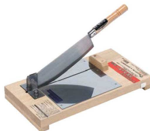
⑨万能カッター ミニ

510×240×H150 刃厚:3mm 刃渡:360 重量:6kg 本体:プラスチックまな板 ステンレス鋼刃物使用 ●2分割、4分割、スライス小間切もできます。