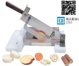
⑤スライスカッター

560×240×H410 刃厚:1.8mm 刃渡:360 重量:5kg 本体:プラスチックまな板 ステンレス鋼刃物使用