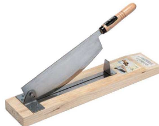
⑩万能プロカッター 背金なし

240×450×H110 背厚:2mm 刃渡:265 重量:2.9kg カット可能幅:230mm 本体:木製ステンレス鋼刃物使用 ※餅・野菜(かぼちゃ等)・魚・長布等の押し切り機です。