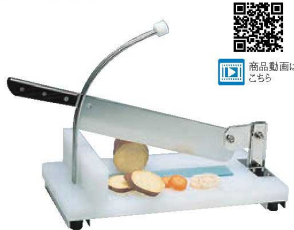
④スライスカッター

サツマイモ・人参・大根・かぼちゃなどの 厚切りスライスに最適です！ ガイドにより厚さが一定してカット出来ます。