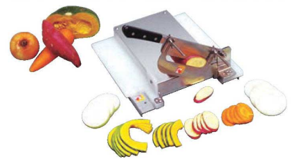
⑥スライスカッター

440×330×H160 カット幅:5~60mm 刃厚:1.8mm 刃渡:360 重量:6kg 本体:プラスチックまな板 ステンレス鋼刃物使用 ●カットガイド付