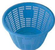
⑤セキスイ 万能カゴ #18 加