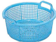
⑥サンコー 丸型 北海簗 加