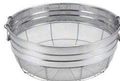
⑩18-8 取手付 広巾ザル(ミノ付)