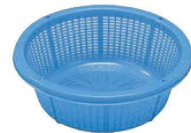
④サンコー バイスケツト #13 加