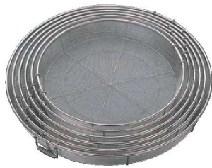
⑫BK 18-8 給食用手付 蒸しカゴ