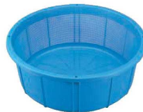
③セキスイ ザルカゴ #35 加