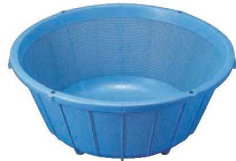
①リス PP バイスケツトⅡ 加