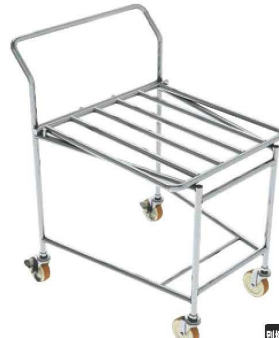
⑨ワンタッチ スタッキングカート フレームタイプ

615×740×H900 材質:ステンレスSUS304 パイプ径:φ217 キャスター:ナイロンφ100×4(内2ヶストップバー付) ●丸洗いでいつも清潔、丈夫で軽いカートです。 ●押し込みだけで簡単、コンパクトに収納できます。 ●商台の水受けトレーで、床に水をこぼしません。 ●学校給食衛生管理基準の指定をクリアしています。 ●凹凸が少なく、汚れがたまりにくい構造です。