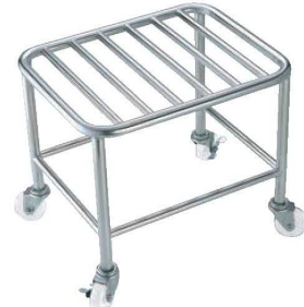
⑩EBM 18-8 ザル置台 角型

615×740×H900 材質:ステンレスSUS304 パイプ径:φ217 キャスター:ナイロンφ100×4(内2ヶストップバー付) ●丸洗いでいつも清潔、丈夫で軽いカートです。 ●押し込みだけで簡単、コンパクトに収納できます。 ●車輪が大きいから動きがスムーズ、車輪交換ができるのもポイントです。 ●オールステンレスでエイジー移りにくく、耐久性に優れています。 ●凹凸が少なく、汚れがたまりにくい構造です。