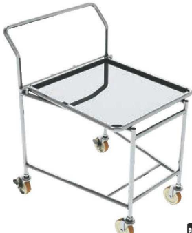
⑧ワンタッチ スタッキングカート トレイタイプ