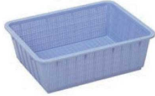
①アシスト カラー角ざる ブルー