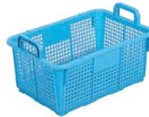
⑥サンコー 角型 北海箒

外寸:392×341×H192 内寸:350×310×H149 材質:ポリプロピレン