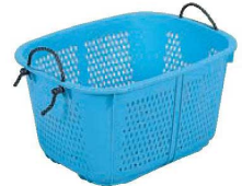
⑦サンコー 万丈箒 2型