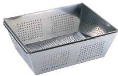
④UK 18-8 パンチング 角ザル