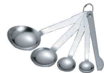
⑩クインローズ 18-0 計量スプーン 4本組 (ヘラ付) F1