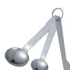
⑫クインローズ 18-0 計量スプーン 2本組 (ヘラ付) F1