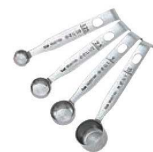
⑱18-8 計量スプーン DH-3006 F1