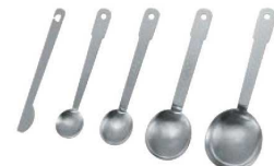
⑬クインローズ 18-0 計量スプーン F1