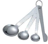
⑪クインローズ 18-0 計量スプーン 3本組 (ヘラ付) F1