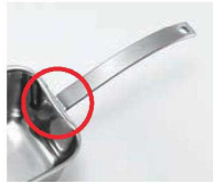
●ハンドルが本体に隙間なく溶接されているので異物流入の心配がありません。