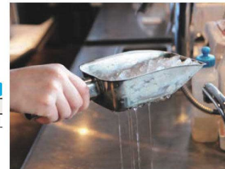
●穴のおかげでスムーズに水が切れ氷のみを簡単にすくう事が出来ます。