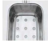
●8mmの穴が9カ所開いています。