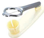
⑧玉子切器 縦型 (2分割 1本線)