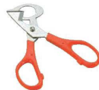
⑰うずらカッター プッチ 71