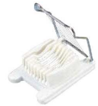
⑤玉子切器 PC台 (8本線)