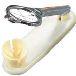
⑦玉子切器 縦型 (6分割)