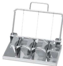
②18-8 縦割三連エッグカッター 71