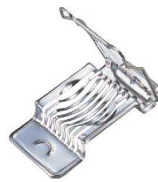
③玉子切器 ステンレス (8本線)