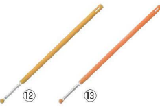
生卵の白身切り まぜ卵 71