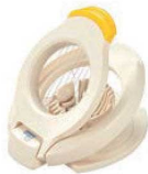
⑥エッグスライサー 71