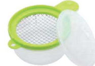
⑱サンドイッチ用 玉子メーカー 71