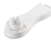
縦切りエッグカッター