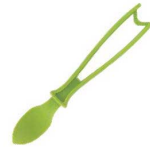
⑭リンデンヨナス PP エッグピーラー 71