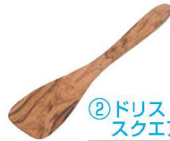
② ドリス・オリーブ スクエアスパチュラ