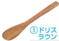
① ドリス・オリーブ ラウンドスパチュラ