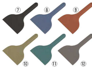
MPF シリコンスクレイパー 大 短柄

幅97×全長200 材質:シリコン/芯材:高強度ナイロン 耐熱温度:180℃ ●食品衛生試験に適合した、食品製造業向けのシリコンヘラです。 ●芯材にも金属検知機に反応可能なブラチックを使用しています。