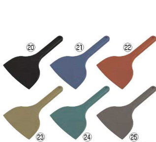
MPF シリコンスクレイパー 大 短柄