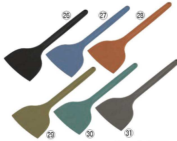
MPF シリコンスクレイパー 大 長柄

幅130×全長210 材質:シリコン/芯材:高強度ナイロン 耐熱温度:180℃ ●食品衛生試験に適合した、食品製造業向けのシリコンヘラです。 ●芯材にも金属検知機に反応可能なブラチックを使用しています。