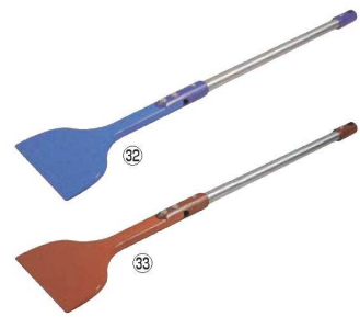
MPF シリコンロングスクレイパー