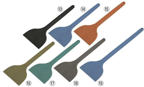
MPF シリコンスクレイパー 大 長柄

幅130×全長210 材質:シリコン/芯材:高強度ナイロン 耐熱温度:180℃ ●食品衛生試験に適合した、食品製造業向けのシリコンヘラです。 ●芯材にも金属検知機に反応可能なブラチックを使用しています。