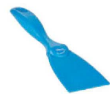
⑲ ヴァイカン MDS ハンドスクレーパー