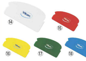
ヴァイカン オリジナルスクレーパー