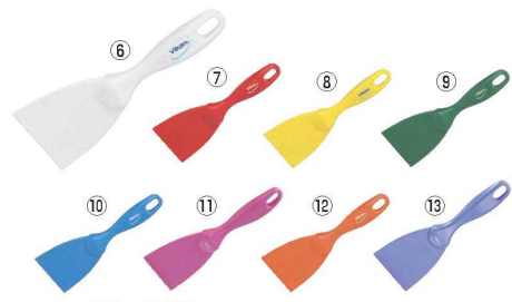
ヴァイカン ハンドスクレーパー 小 4060