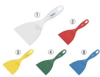
ヴァイカン ハンドスクレーパー 大 4061