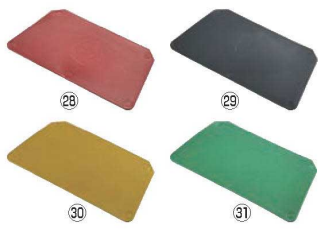
パーキンタ スクレーパー 大

幅200×H125 材質:ポリプロピレン(鉄粉配合) 耐熱温度:120℃ ●金属検出機で検出できる樹脂製のスパチュラです。 ※金属検出機の設定、製造されている食品の種類や形状等により検出可能な樹脂片の大きさが異なります。