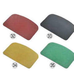
パーキンタ スクレーパー 小

230×118×厚さ2.0 材質:ポリプロピレン/鉄成分 ●金属検出機で検出できる樹脂製のスクレーパーです。 ※金属検出機の設定、製造されている食品の種類や形状等により検出可能な樹脂片の大きさが異なります。