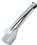
⑫ 18-10 バッフェ トーストong