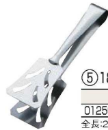
⑤ 18-10 トーストong