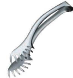
⑪ 18-10 バッフェ スパゲティ tong