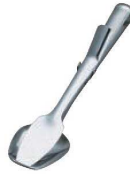
② 18-10 クリップ型 サービス tong