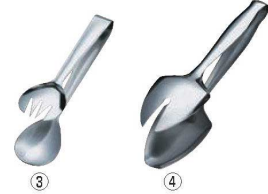
18-10 サービス tong