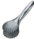
⑩ 18-10 シェル型 ブレード tong