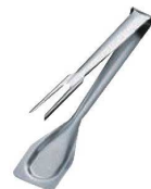
⑭ 18-10 バッフェ ミートong