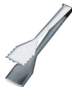
⑬ 18-10 バッフェ tong