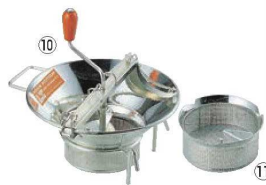
⑩ LT スズメッキ ムーラン