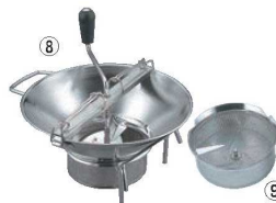
⑧ LT 18-10 ムーラン