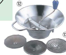
⑫ LT 18-10 ムーラン