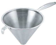
⑥ UK 18-8 片手コランダー (モナカハンドル)