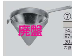
⑦ メロディ 18-8 スープ漉