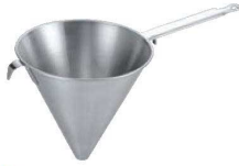
① デバイヤー 18-10 シノア 極細目