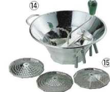
⑭ LT スズメッキ ムーラン