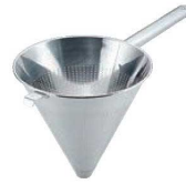
⑤ UK 18-8 パンチング スープ漉