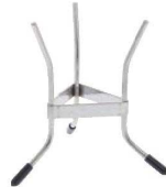
② デバイヤー シノア スタンド