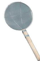
⑥18-8 木柄 丸型 スクイアミ 極荒 ㊦