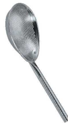
②UK 18-8 パンチング 小判スクイ玉揚