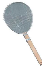
⑤18-8 木柄 スイノー型 スクイアミ 極荒 ㊦