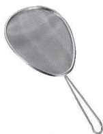
⑦18-8 手付 スクイザル ㊦