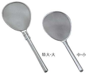
①18-8 パイプ柄 小判型 プロすいのう ㊦