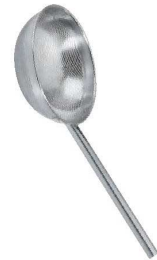
③UK 18-8 パンチング 丸型スクイ玉揚