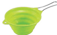
⑪ハンドル付きシリコン ストレーナー グリーン ㊦