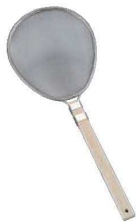
④18-8 木柄 小判型 プロすいのう ㊦

④φ270 ⑤φ340 重量:600g パンチング穴径:2.2mm 深さ:100