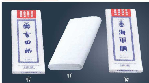
⑩EBM さらし (吉田晒)