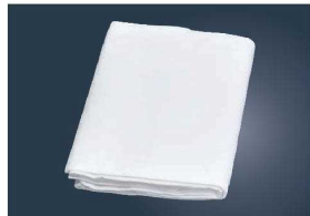
⑥EBM ネット地 だし布