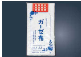
⑦EBM ガーゼ布 (吉田晒)