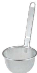
②18-8 プロみそこし (16メッシュ) 切 ページコード 商品コード 価格 4-0596-0201 0217110 ¥3,850 ①170 ②110 ③220 ●引掛付