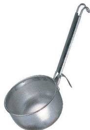
①UK 18-8 パンチング こしテポ ページコード 商品コード 価格 4-0596-0101 7435600 ¥8,500 外寸:①170 ②115 ③245 パンチング穴径:1.1mm ●引掛付