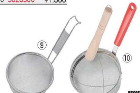
⑨18-8 万能こし (12メッシュ) ページコード 商品コード 価格 4-0596-0901 2310370 ¥810 ①120 ②83 ③157 ●「す」「棒」で「水」を「きる」の3役をこなす万能こし器