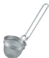
⑯18-8 共柄ミニ味噌こし (14メッシュ)