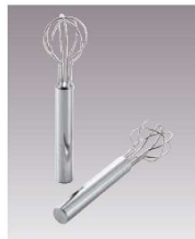
⑱18-8 パイプ柄 味噌取モドラー