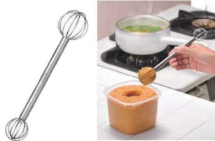
⑰計量みそモドラー 切