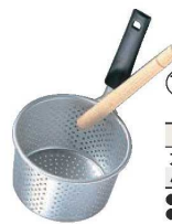
⑮アルマイト PC柄 みそこし (こし棒付)