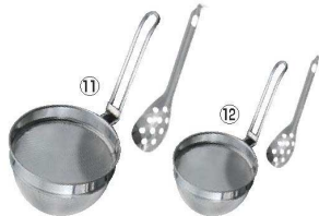
18-8 共柄万能こしセット (レンゲ付)