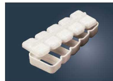
⑨PP にぎり寿司 押し型