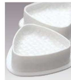
⑭PP ダイアカット おにぎり型 2ヶ器