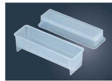
⑤マジック太巻寿司型