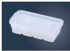
④マジック握り寿司型