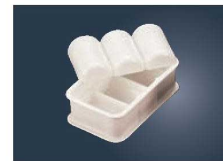
⑩PP 俵むすび 押し型 3ヶ取