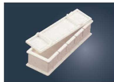
⑧PS 押し寿司 押し枠 5ヶ取