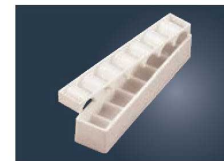
⑪PS 幕の内 押し型 7ヶ取