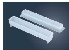
⑥マジック細巻寿司型