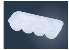
③マジック幕の内型