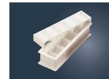
⑫PP 幕の内 押し型 5ヶ取