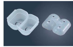
②マジック俵おにぎり型