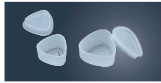
①マジックおにぎり型

ダブルエンボス加工で ごはんがこびりつきません。 ギュッとつめてポンと押すだけ 型ばなれよく、お手入れラクラク