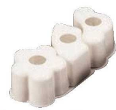
⑯PP 押し型 松竹梅