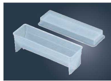
⑦マジック三角寿司型