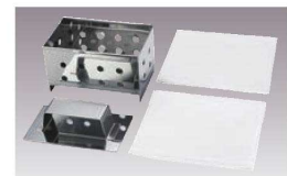
⑧ステンレス手造り 豆腐造り型