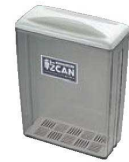
⑤のり乾カン (乾燥剤付) 71