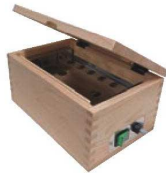
②のり電機乾燥器 エパーホット栓 71