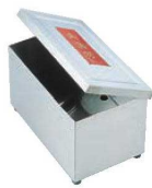
①EBM 電気 のり乾燥器 71