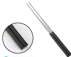
④純チタン 黒檀柄盛箸(ステンロ)