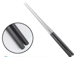
③本焼ステンレス 黒合板 六角柄盛箸