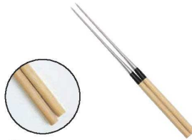
②本焼ステンレス 朴柄盛箸