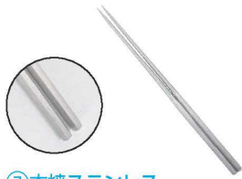
⑦本焼ステンレス 六角柄盛箸