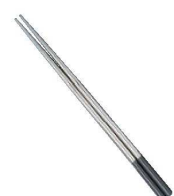
⑨18-8 プラ付 菜箸