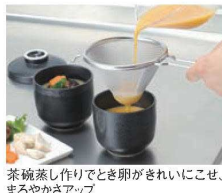
茶碗蒸し作りでとき卵がきれいにこせ、まろやかさアップ