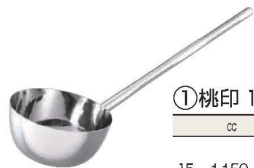
①桃印 18-8 長柄付ひしゃく 楕円グリップ