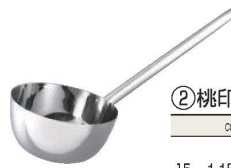
②桃印 18-8 長柄付ひしゃく 三角グリップ

●ハンドル部φ25(ネック及びグリップエンドを除き楕円加工) ※ご注文の際は、口径、柄の長さをご指定ください。 その他、ご希望の柄の長さの特注も製作いたします。