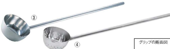
③桃印 18-8 長柄付口付 ひしゃく