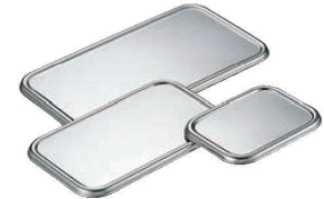
⑥クローバー 18-8 深型 長バット蓋