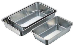
⑪クローバー 18-8 T型バット