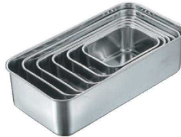
⑤クローバー 18-8 深型 長バット