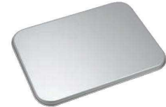
③アルマイト 大型 角バット蓋