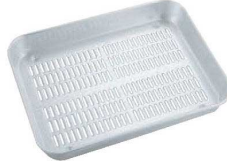
②アルマイト 穴付 大型 角バット