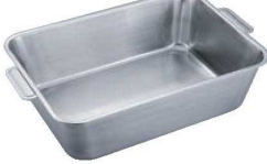
⑦UK 18-8 深深バット 手付