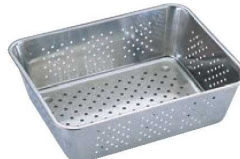
⑩UK 18-8 野菜水切りバット