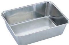
⑨UK 18-8 深深バット