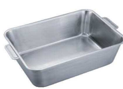
⑦UK 18-8 深型バット 手付