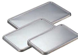
⑫クローバー 18-8 T型バット蓋