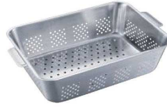
⑧UK 18-8 野菜水切りバット 手付