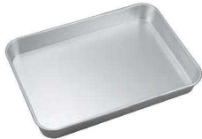
①アルマイト 大型 角バット